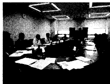
古物営業防犯対策専門部会(写真)