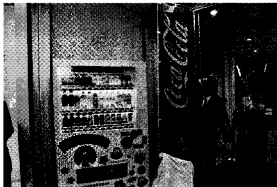
防犯メッセージボード付自販機(写真)