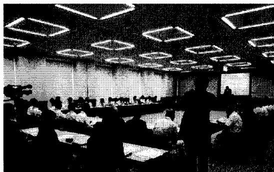
特殊詐欺水際対策会議(写真)

4月25日及び7月26日「 特殊詐欺水際対策緊急会議等 」を開催 近年、振込め詐欺等被害金額が深刻な状況であることから、より積極的且つ効果的な金融機関における水際振込め詐欺等被害防止対策を検討し、情報の共有化を図った。