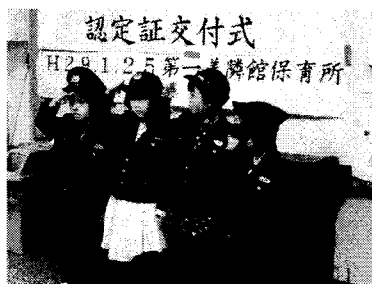
平成29年1月25日 エンジェルポリス認定式(写真)