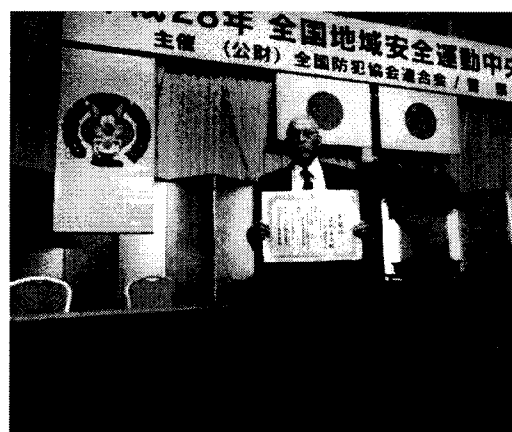
平成28年9月29日全国中央大会(写真)

10月、全国地域安全運動に伴う関係機関・団体等と連携し、金沢市香林坊・武蔵ヶ辻等や県内一円において街頭キャンペーン等を実施し、防犯意識の高揚促進に取り組んだ。