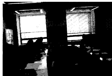
石川県コンビニ等防犯連絡協議会(写真)

11月8日 「石川県コンビニ等防犯連絡協議会」を開催し、万引き・コンビニ強盗事件の具体的対策を検討