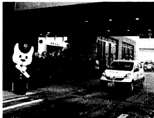
青パト贈呈式(写真)

平成28年12月14日、羽咋警察署において、当防犯協会連合会から羽咋郡市防犯協会に対して、青パト1台(軽四車)の贈呈式を行った。