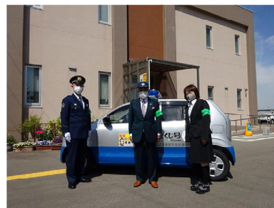
<青パト配備の状況>

本年度、全国防犯協会連合会から当連合会に譲渡された青パト1台について、2月、金沢東防犯協会に配備し、地区防犯協会の防犯環境の充実を図った。