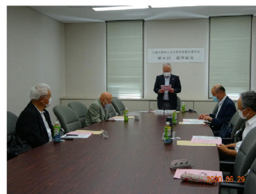
<通常総会の開催状況>

令和2年6月29(月) 会 場 石川県地場産業振興センター 第8回石川県防犯協会連合会通常総会 (新型コロナウイルス感染拡大防止のため、 正会員には書面議決を依頼) 主な出席者～永山会長他役員等