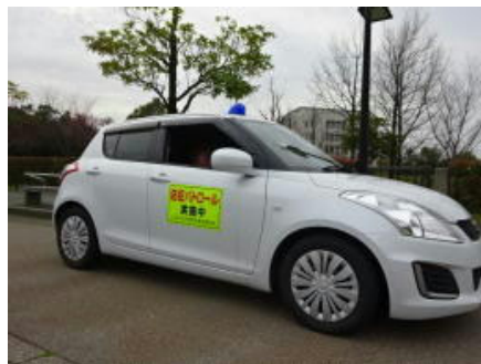
<パトロールの状況>

平成30年8月に、当連合会所有車両の青パト認定を受け、金沢市内全域を活動範囲とし、年間を通して、児童・生徒の登下校時を中心としたパトロール活動を実施した。