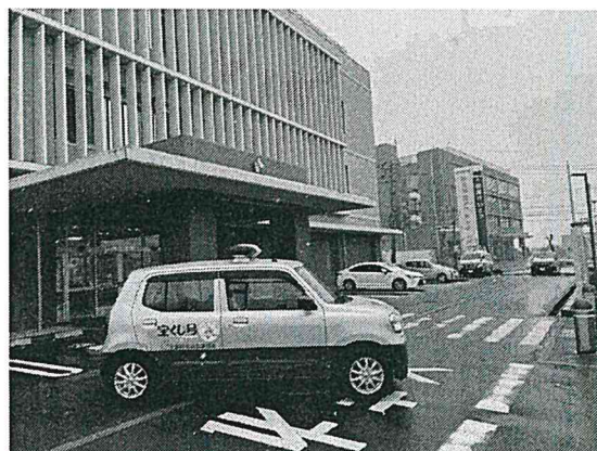
【青パトの配備状況】

本年度、全国防犯協会連合会から当連合会に譲渡された青パト1台について、12月22日、能美防犯協会に配備し、地区防犯協会の防犯環境の充実を図った。