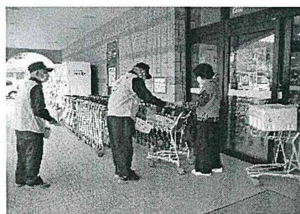
【特殊詐欺被害防止キャンペーン】