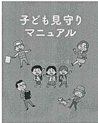
公益社団法人全国防犯協会連合会 この冊子は、全国防犯協会連合会が主催する防犯啓発活動の一環として作成したものです。