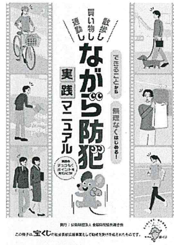
財団：公益社団法人 全国防犯協会連合会 この冊子は、広く社会貢献活動の一環として制作・発行されたものです。