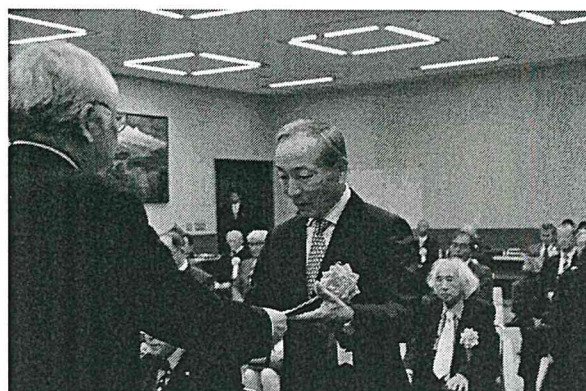
【防犯功労者・防犯功労団体表彰式】