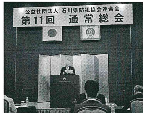
【通常総会の開催状況】