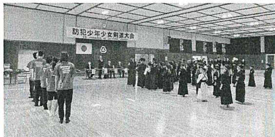
【小松市防犯少年少女剣道大会】

各地区防犯協会において、少年柔剣道・相撲・ソフトボール大会などを主催するなど、スポーツ活動を通じて少年の健全育成を支援した。