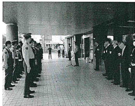
【地区防犯協会 地域安全出発式】